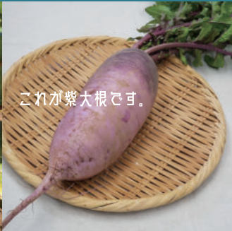
これが紫大根です。