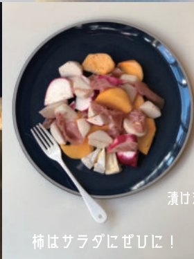
柿はサラダにぜひ！