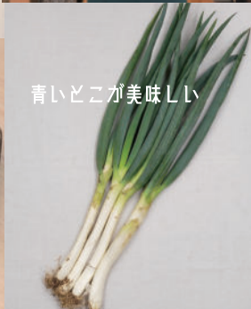
青いところが美味しい