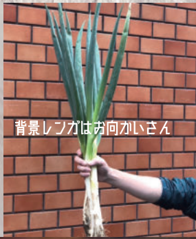
背景レフカはお向かいさん