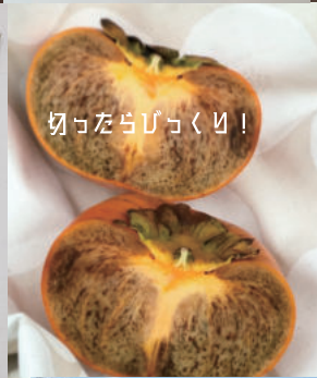
切ったらびっくり！