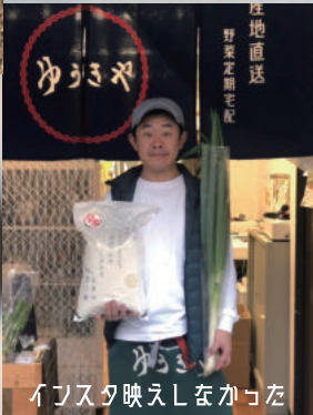
インスタ映えしなかった