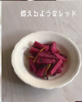
燃えるようなレッド