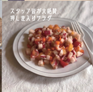
スタッフ皆が大絶賛、 押し麦入りサラダ