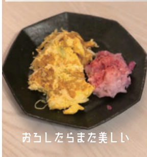
おろしたらまた美しい