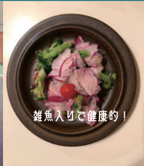
雑魚入りで健康的！