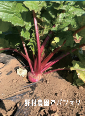
野村農園でバジマリ