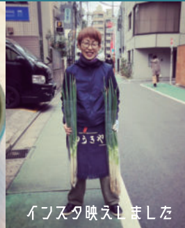
インスタ映えしました