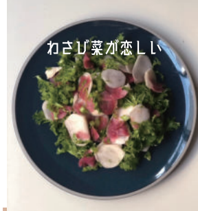
わさび菜が恋しい